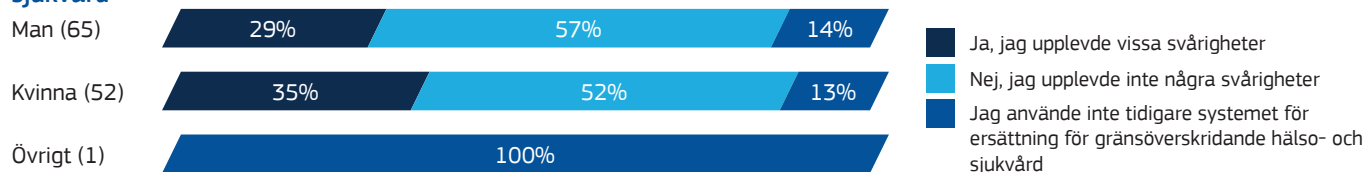
Figur 4 – Erfarenhet av och svårigheter när man använt systemet för ersättning för gränsöverskridande hälso- och sjukvård

Källa: EU-enkät, 2020 års offentliga samråd om EU-medborgarnas rättigheter. Anm.: Antal bidrag: 240